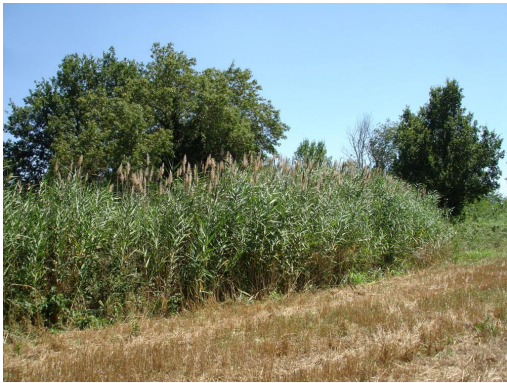
Phragmitaie en accompagnement de la ripisylve.