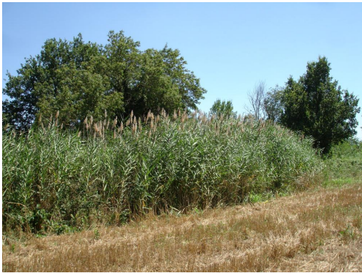
Phragmitaie en accompagnement de la ripisylve.