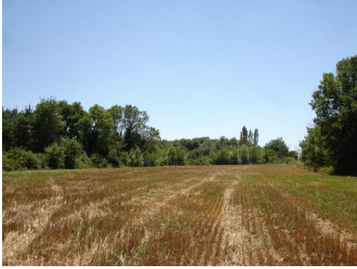
Ripisylve continue en limite de cultures vers le Mas de Robin.