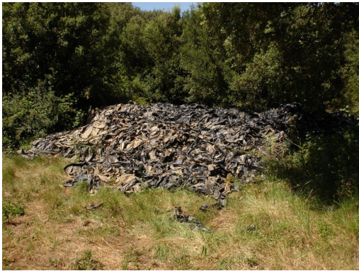
Dépôt de bâches plastiques à proximité de la ripisylve vers le Mas de Robin.