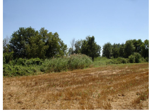
Petite zone de phragmitaie sur les berges du valat vers le Mas de Robin.