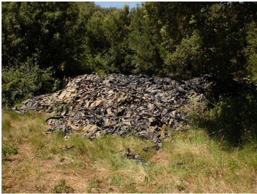
Dépôt de bâches plastiques à proximité de la ripisylve vers le Mas de Robin.