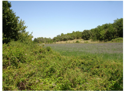
Berges enfrichées en aval du Mas de Robin.