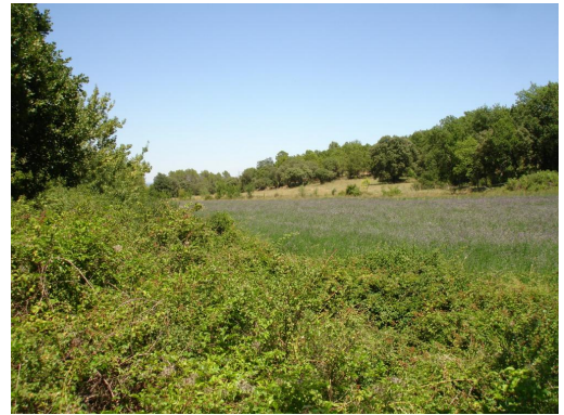
Berges enrichées en aval du Mas de Robin.