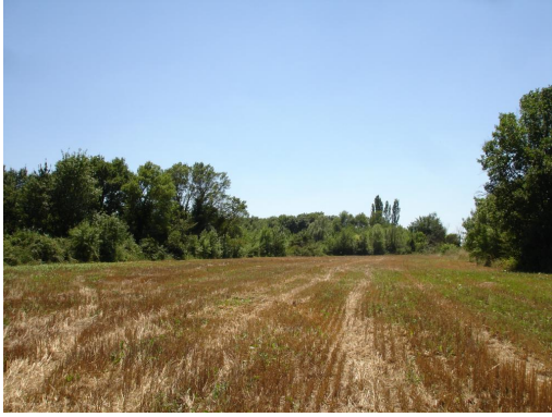
Ripisylve continue en limite de cultures vers le Mas de Robin.