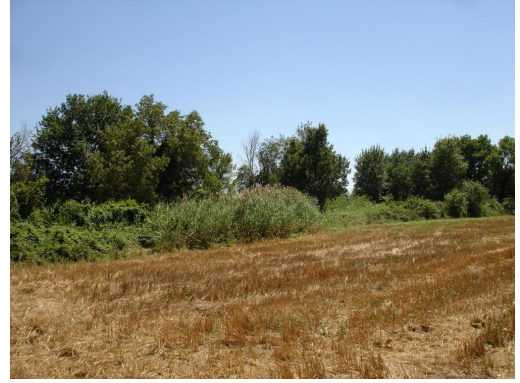
Petite zone de phragmitaie sur les berges du valat vers le Mas de Robin.