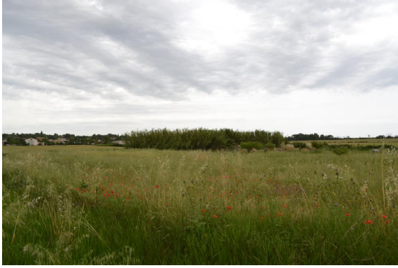
Cannes de Provence vers la Font des Près.