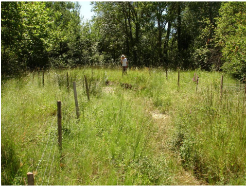
Zone de résurgence mise en défens avec entretien d'une petite prairie humide.