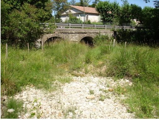
Zone de résurgence en amont de la D999 avec petite prairie humide à proximité du captage AEP.