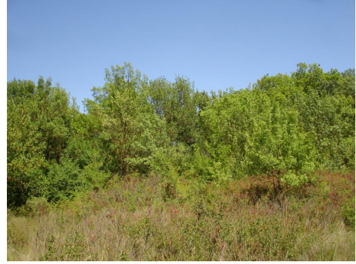
Ripisylve continue dominée par les frênes en fond de vallon.