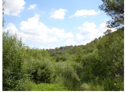
Ripisylve à saules continue vers la Font de naval.