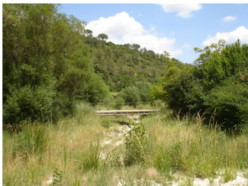
Ripisylve discontinue en aval de la retenue.