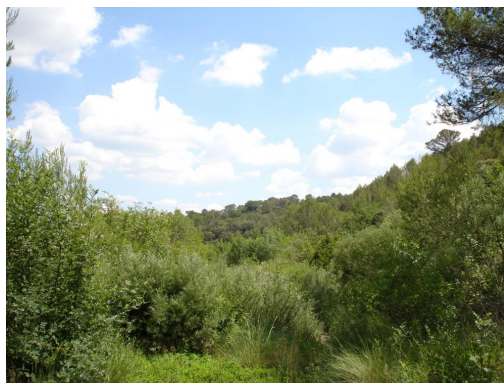
Ripisylve à saules continue vers la Font de naval.