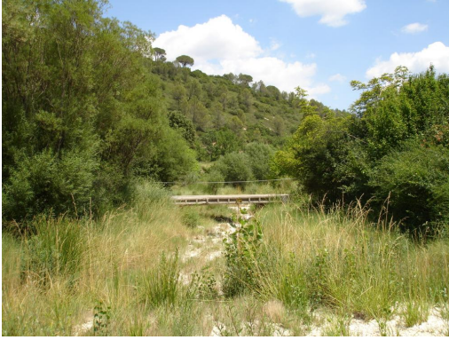
Ripisylve discontinue en aval de la retenue.