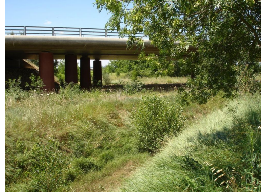
Passage sous le pont de la N106.