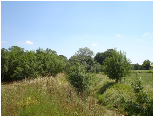
Ripisylve éparses et boisement de frênes en amont de l'ancienne nationale.