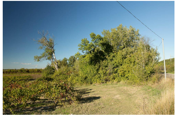
Bosquet isolé contre la route de Montfrin.