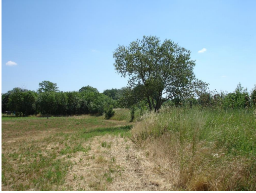
Ripisylve éparses sur cours d'eau canalisé en aval de la N106.