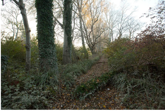
Bordure de manade.