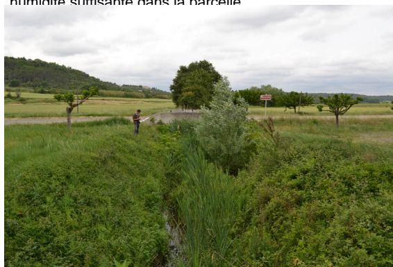
Typhaie et autres hydrophytes développées en aval de la D979, berges abruptes et rectilignes.