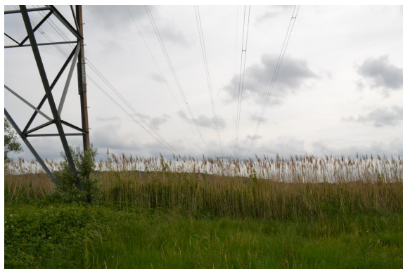
Berges du ruisseau colonisées par les roseaux en aval de la D979 en rive droite au niveau de la prairie en cours d'enfrichement.