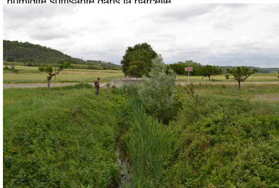
Typhaie et autres hydrophytes développées en aval de la D979, berges abruptes et rectilignes.