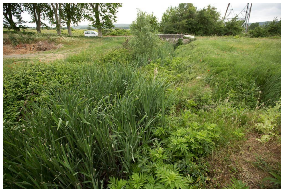
Typhaie bien développée depuis le pont amont.