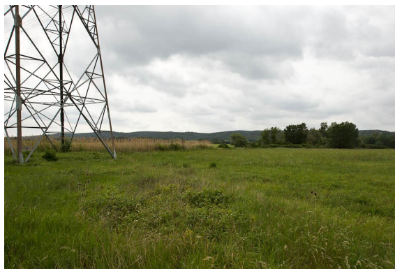
Roselière et ripisylve se succèdent en bordure d'une prairie mésophile. Le cours d'eau est ici trop incisé pour conserver une humidité suffisante dans la parcelle