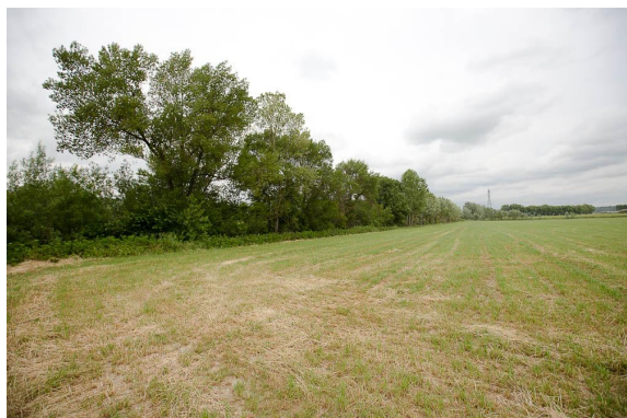
La ripisylve est mieux développée, quoique toujours contrainte, dans sa partie aval.