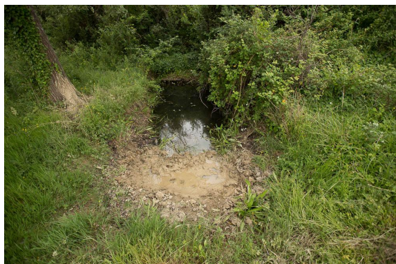
En lisière de prairie, une mare artificielle de 2 mètres de large environ, avec une végétation hygrophile et de nombreux Tritons palmés.