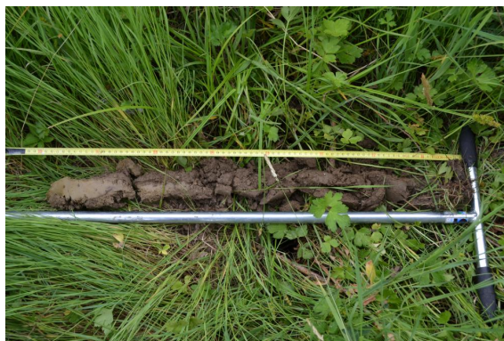
Colluvisol-rédoxisol avec traces d'hydromorphie dans les 50 premiers cm du sol s'intensifiant en profondeur - sondage positif.