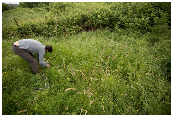
Partie basse de la prairie humide, à Carex et Oenanthe.