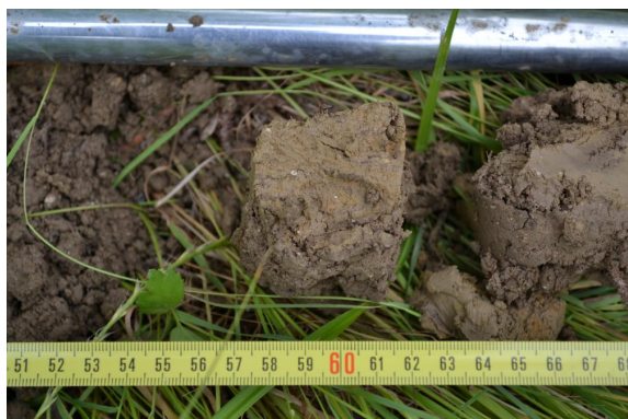
Traces d'hydromorphie identifiables et s'intensifiant en profondeur.