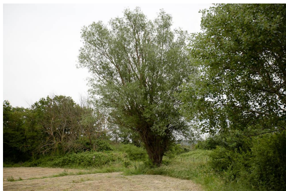
Le gros Saule blanc en bas de prairie fauchée qui a attiré notre attention.