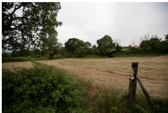
Prairie humide fauchée, traversée par un fossé drainant.