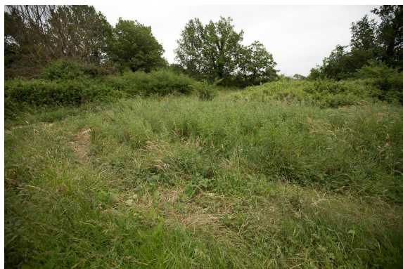
La prairie se perd ensuite dans une friche plus sèche envahie par les ronces.