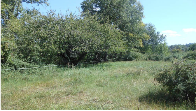
Prairies sèches bordant la ripisylve en rive droite.