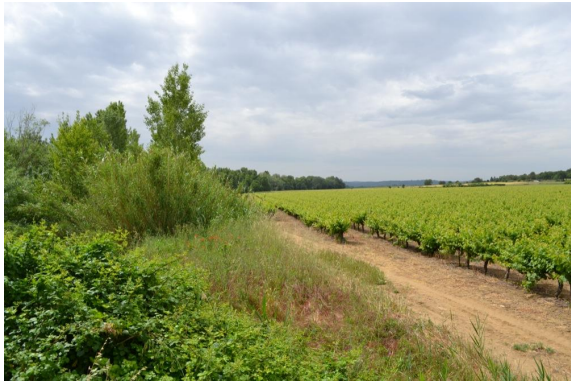
Ripisylve continue à discontinue colonisée par la Canne de Provence sur berges abruptes vers le Mas de Puget.