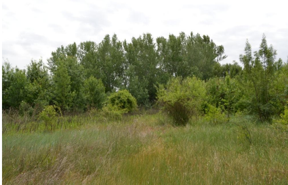
Prairies enrichies et colonisée par des Frênes contiguë à la ripisylve à tendance mésophile.