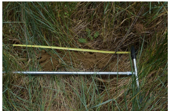
Fluviosol sans traces d'hydromorphie identifiables - sondage négatif.