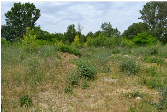
Zone de décharge de matériaux inertes et de remblai vers la D22.