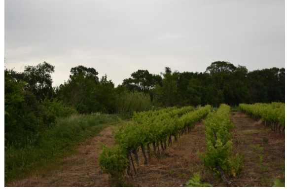
Ripisylve discontinue avec développement de Cannes de Provence en aval de Viviers.