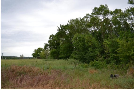
Ripisylve continue vers le Viviers en limite d'une prairie mésophile.