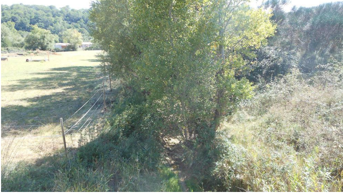
Ripisylve continue en limite de prairie mésophile.