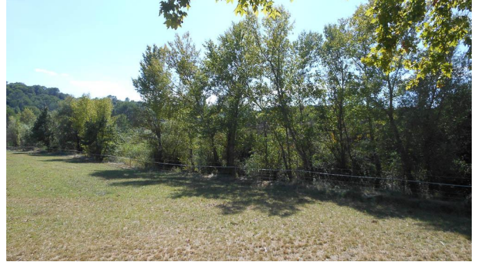
Ripisylve continue en aval de la D981.