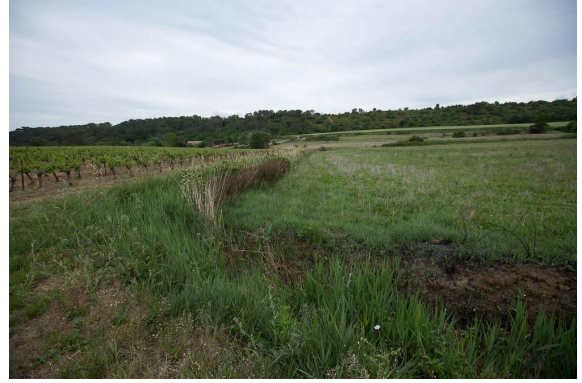
La phragmitaie se développe dans les secteurs ensoleillés.