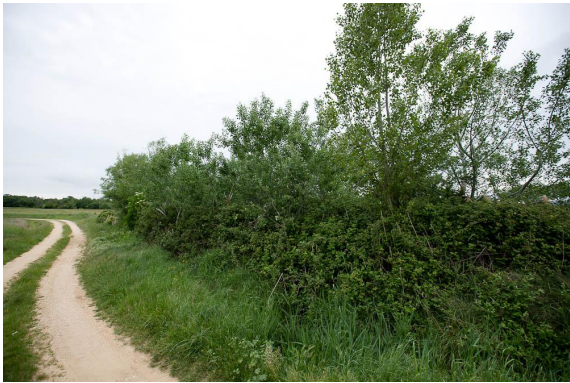
Les peupliers se développent dans la partie amont de la zone humide.