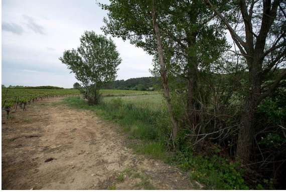
Ripisylve très dégradée sur le cours d'eau à sec.