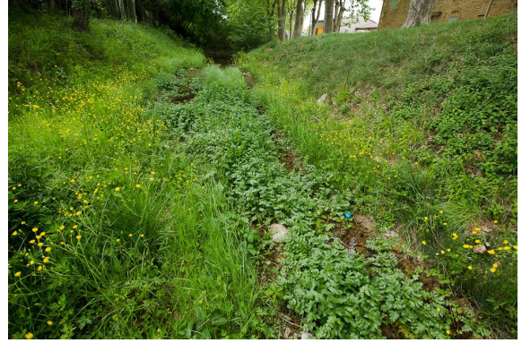
Végétation hygrophile favorable à l'Agrion de Mercure, avec ces herbiers à Helosciadium nodiflorum .