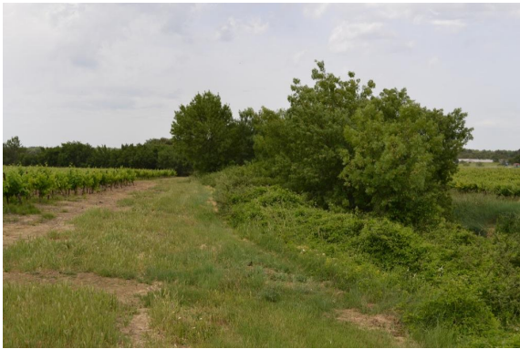
Ripisylve discontinue et enrichée vers les Condamines.