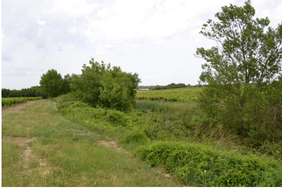
Ripisylve discontinue et enrichée vers les Condamines.