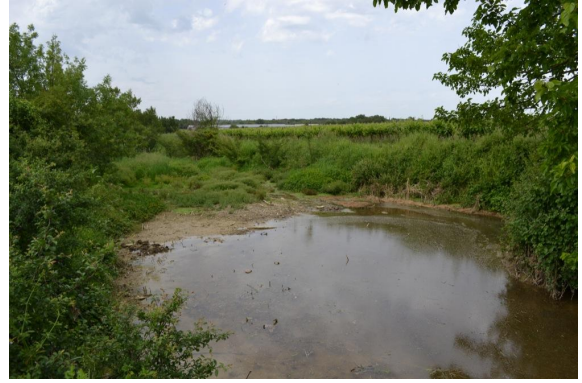
Petite zone en eau temporaire en partie aval au niveau du franchissement de la voie communale.