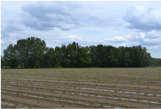
Ripisylve continue en limite de cultures.