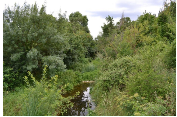
En aval de la D18 vers le Moulin de Chabaud.