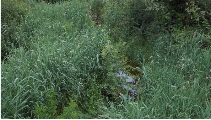
Végétation hygrophile bien développée.