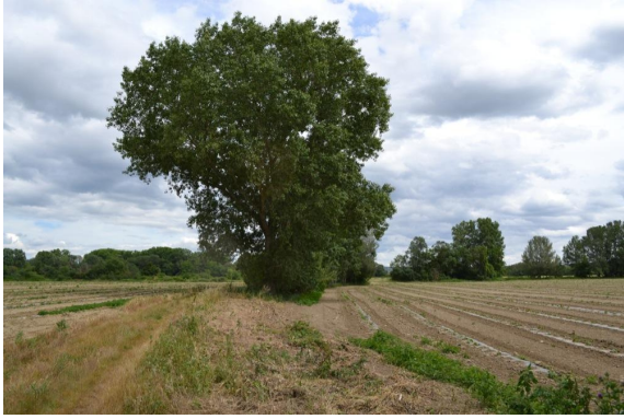
Ripisylve discontinue à éparses sur fossé.