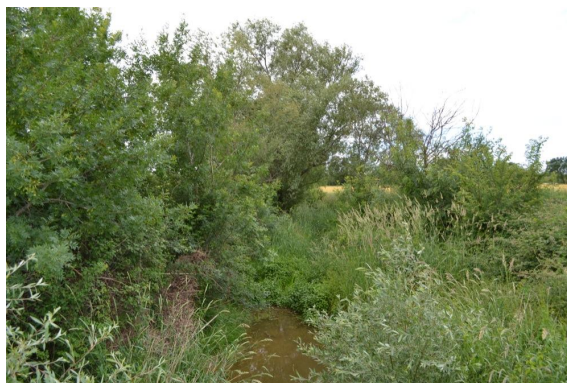
Ripisylve continue à discontinue.