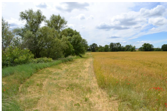
Ripisylve en limite de cultures avec une bande enherbée.