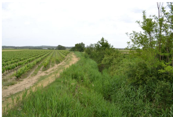
Ripisylve éparse et Phragmitaie sur les berges du ruisseau en amont de l'ancienne voie ferrée.