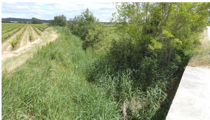
Vue générale depuis l'ancienne voie ferrée.