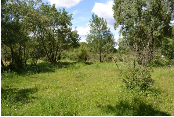
Bosquet de Frênes en limite de prairies mésophiles.