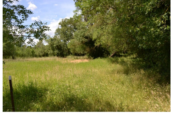
Frênes en cours de colonisation de la prairie.