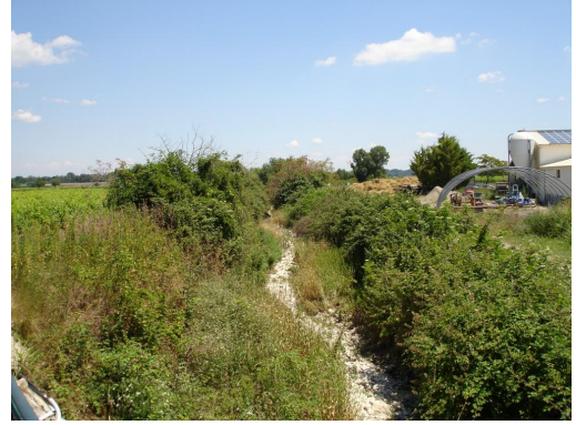
Ripisylve épaisse et enrichie en aval de la D424.