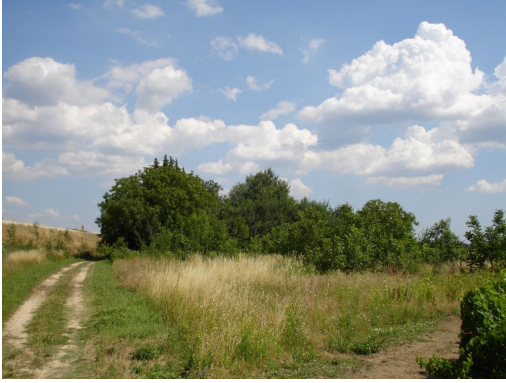
Recolonisation par les Frênes.