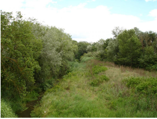
Ripisylve continue et lit mineur dominé par les hélophytes depuis le pont de la D114.