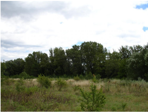
Ripisylve continue en aval du pont de la D114.