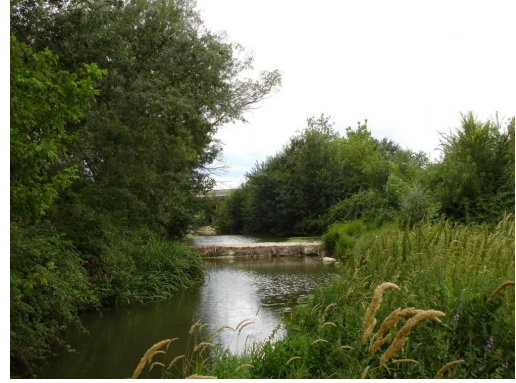
Lit mineur en amont du pont de la D114 avec végétation hygrophile.