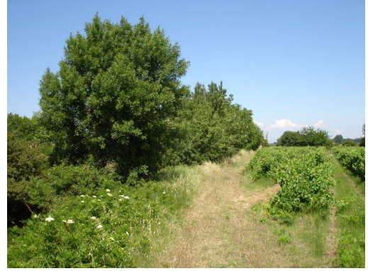
Ripisylve éparse enrichée.