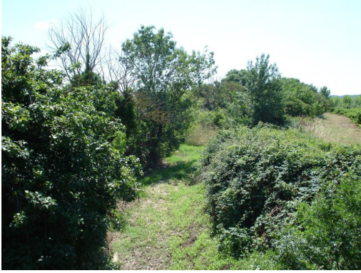
Ripisylve discontinue en amont de la confluence avec le ruisseau de Rouvégade.