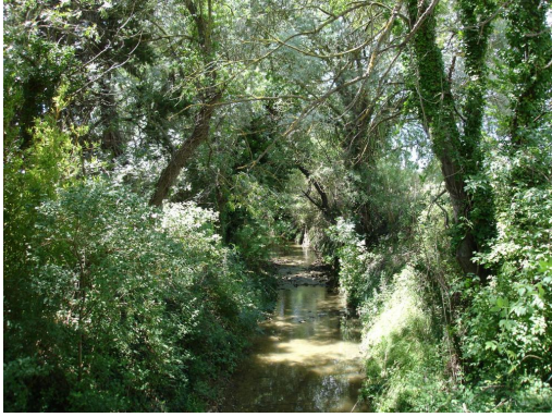
Ripisylve continue au niveau du pont vers les serres.