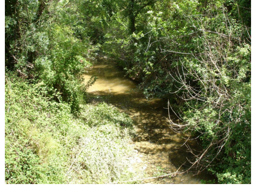
Ripisylve sur cours d'eau incisé vers les Serres.