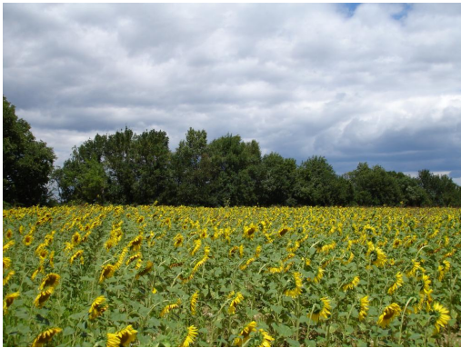
Ripisylve continue vers les Prades.