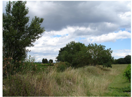
Ripisylve discontinue et cours d'eau incisé vers les Grès.