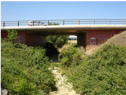
Passage sous la N106.