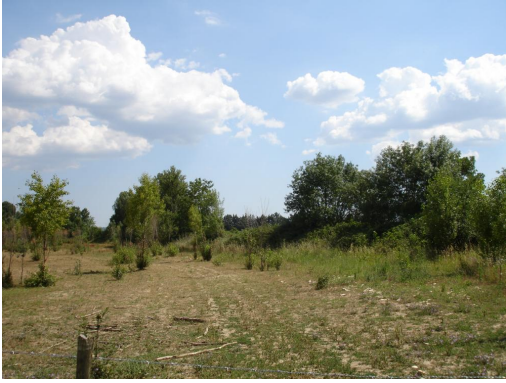
Ripisylve discontinue vers le Pont Caladal.