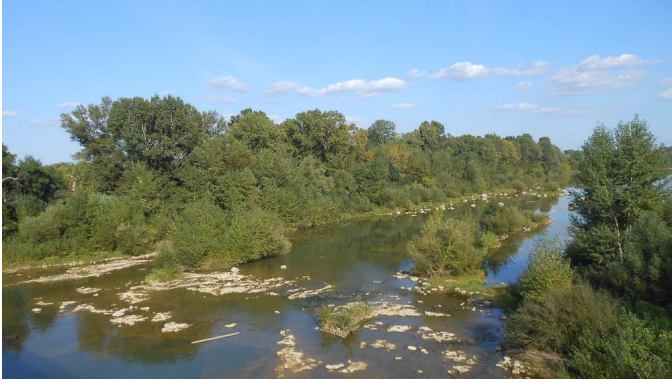
Vue depuis le pont de Moussac.