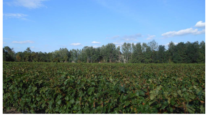
Vue générale sur la ripisylve.