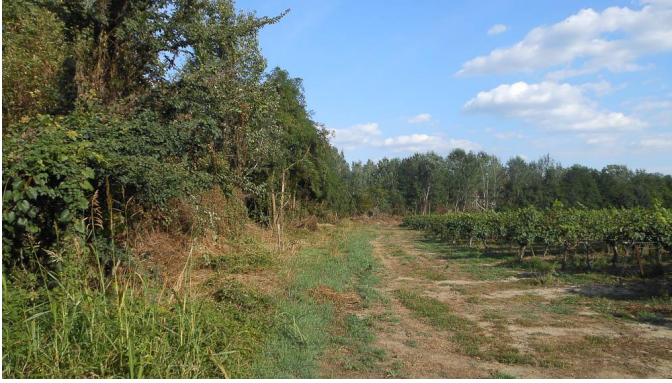
Ripisylve continue en bordure de vigne.