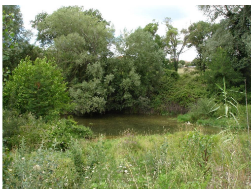
Ripisylve continue à discontinue en aval de la D210.