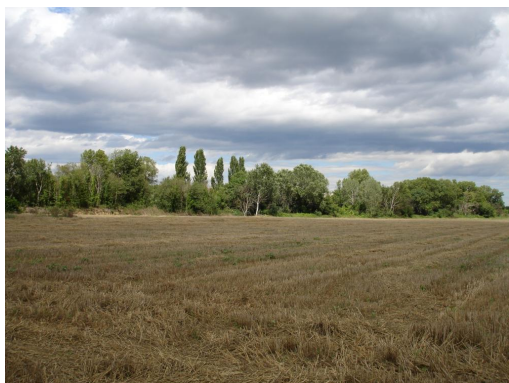
Ripisylve continue en limite de terres cultivées vers la Coudoulière.