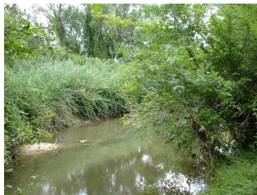
Ripisylve continue sur cours d'eau incisé en aval de la confluence avec le ruisseau de Pierrau.