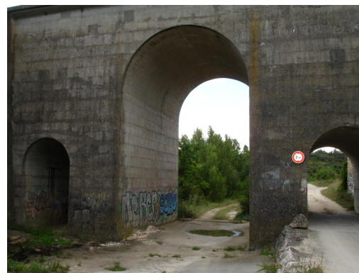
Passage sous le pont de la voie SNCF.