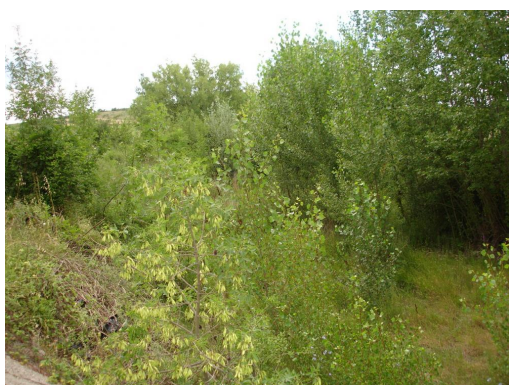
Ripisylve en aval du pont de la voie SNCF.