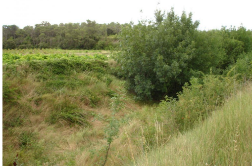
Ripisylve discontinue sur cours d'eau temporaire canalisé et incisé en aval de la voie SNCF.