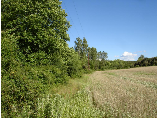
Ripisylve continue vers Larialle.