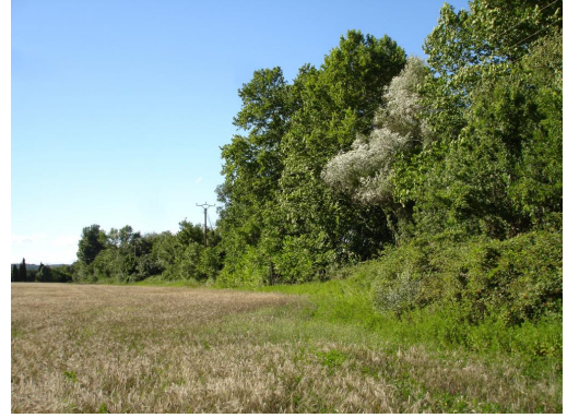
Ripisylve continue en aval de Larialle.