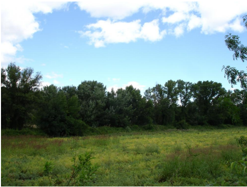
Ripisylve continue en aval de la D907.