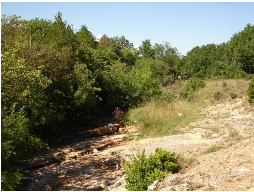
Ripisylve discontinue et écoulement du cours d'eau sur roche mère calcaire.