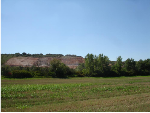
Ripisylve continue au niveau de la carrière.