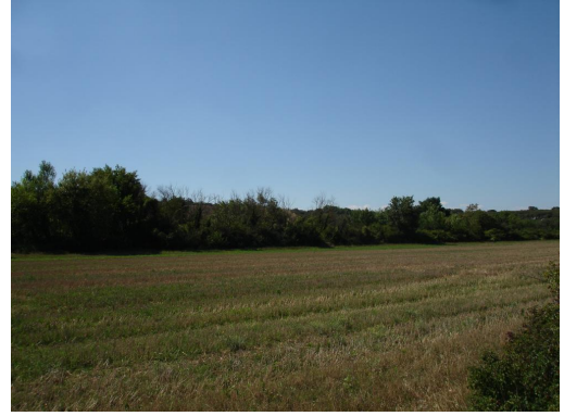
Ripisylve continue en limite de cultures sur cours d'eau canalisé.