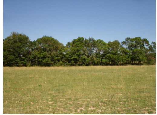
Ripisylve continue en aval de la carrière.