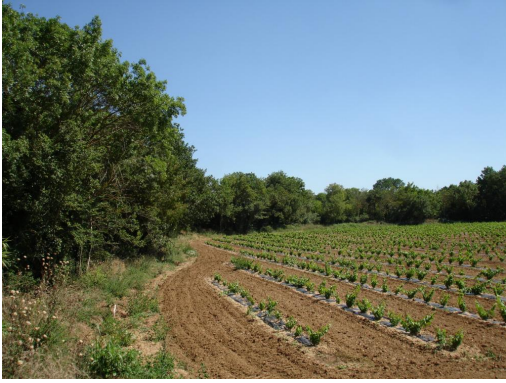
Ripisylve continue en amont de la D22.