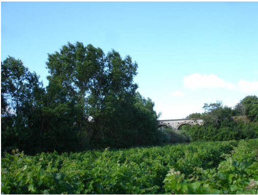
Ripisylve continue à l'aval de la voie SNCF.