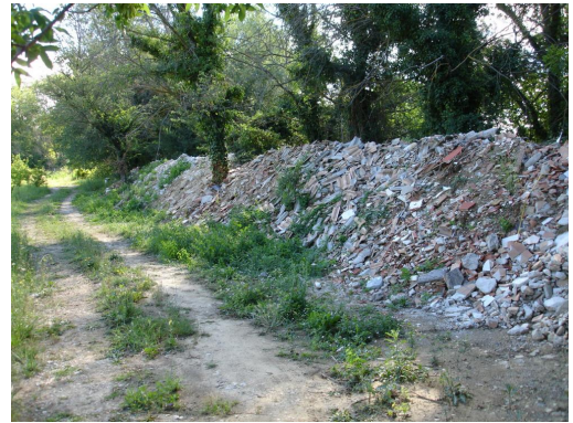
Dépôt de remblai sur les berges du ruisseau vers La Condamine.