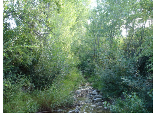
Ripisylve et lit mineur colonisé par des hélophytes à l'aval de la voie SCNF.