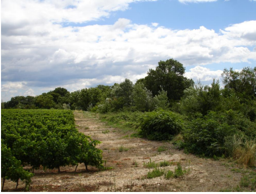
Ripisylve discontinue enrichée.