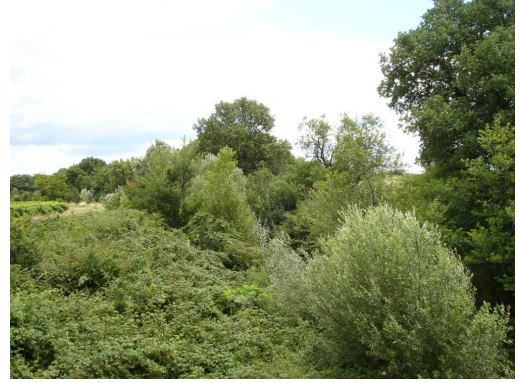
Ripisylve discontinue enrichée.