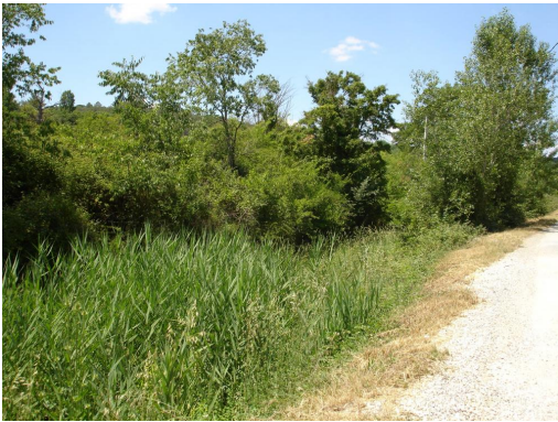
Roselière et prairie à Phalaris en partie aval.