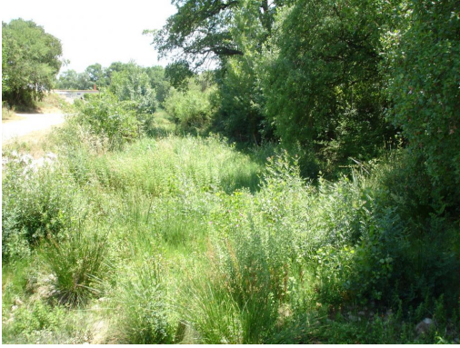
Lit mineur à hélrophytes au niveau de Tavillan.