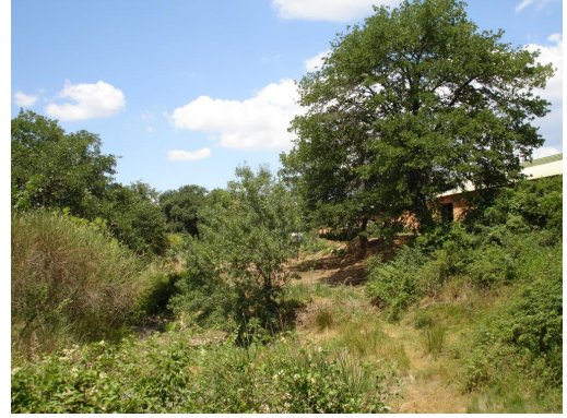
Ripisylve éparse vers le centre équestre de Tavillan.