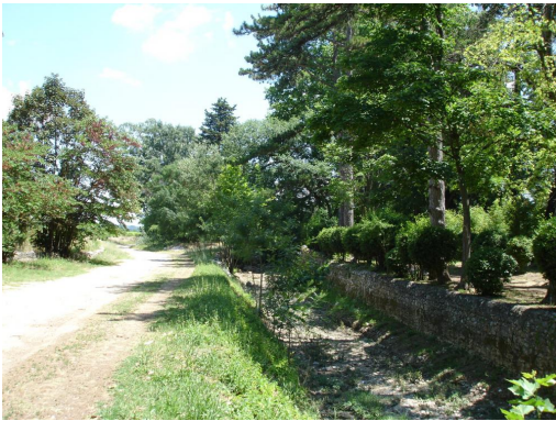
Ripisylve éparse en amont de la STEP.