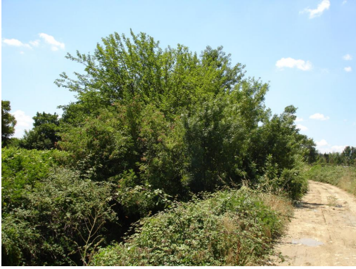
Ripisylve discontinue et enrichée en aval de la STEP.