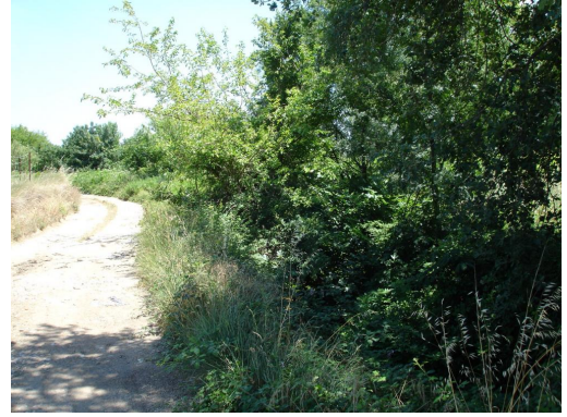
Ripisylve discontinue et enrichée en aval de la STEP.