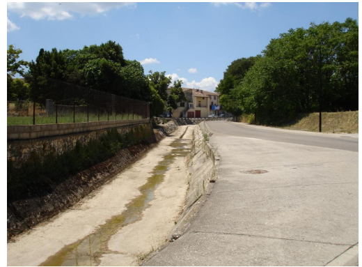
Lit du cours d'eau bétonné dans le centre du village.