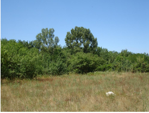
Ripisylve continue en aval de D374.