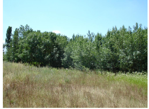
Colonisation par les Frênes.