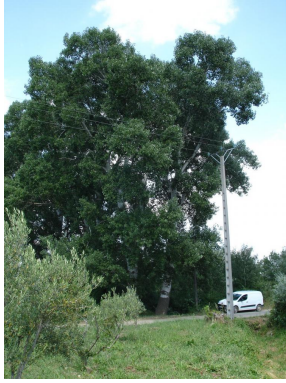
Grands Peupliers Blancs en amont de Sauzet.