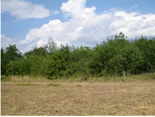
Bosquet de ripisylve de Frênes en aval de la Réglisserie.