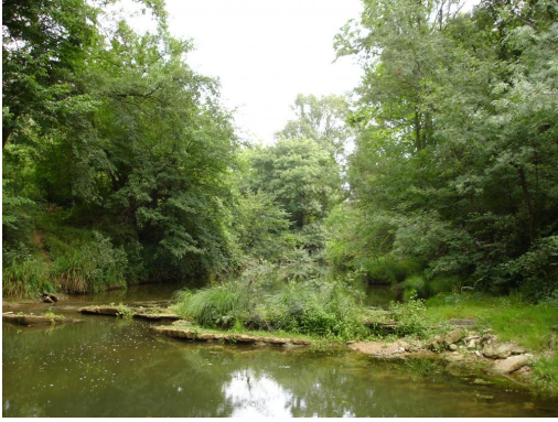
Ripisylve continue en aval de la D18c.