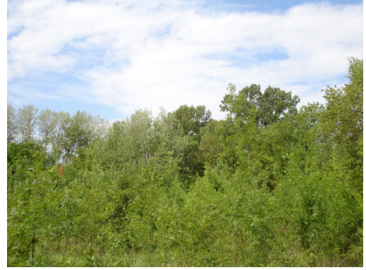
Bosquet de frênes en limite de ripisylve sur ancienne zone de cultures.