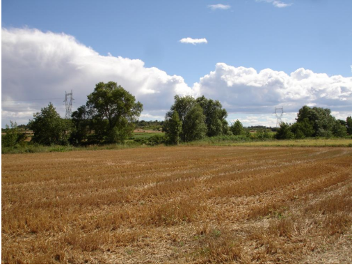
Ripisylve discontinue en amont de la D1.