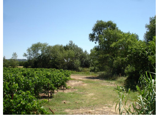
Ripisylve continue sur cours d'eau canalisé vers Bas Montagnon.