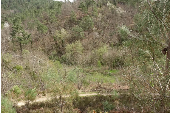
La ripisylve est insérée dans le boisement mixte de fond de vallée.