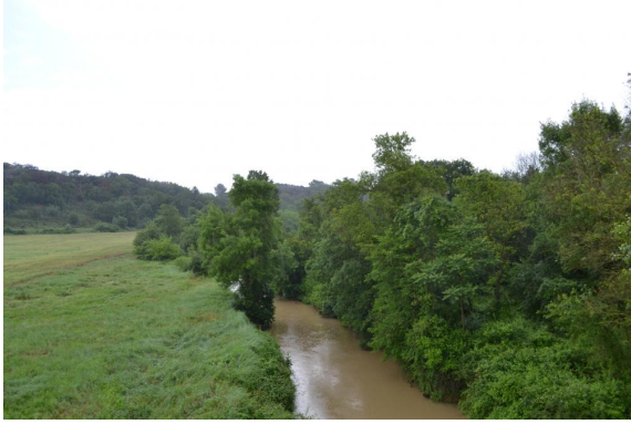
Aperçu de l'Avène depuis le viaduc du chemin de Trespeaux.