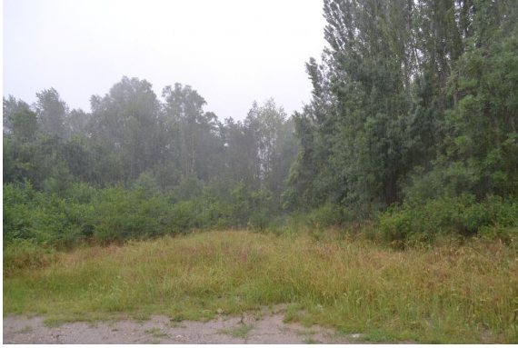
Bosquet de Frênes et Peupliers vers les Prés sous un gros orage.