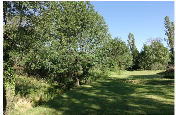
De beaux frênes se développent sur le site, en alignement le long du ruisseau ou en boisement.