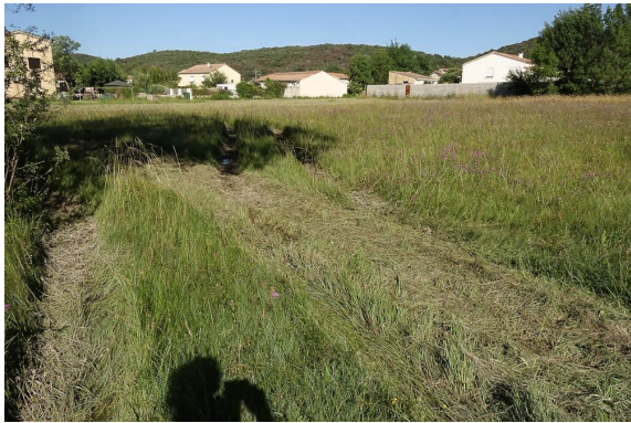
Le caractère humide ne fait pas de doute : fauche stoppée pour cause d'embourbage...