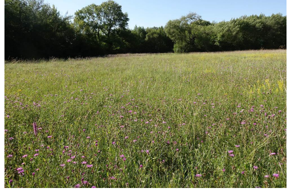
Prairie fleurie à nombreuses plantes des zones humides.