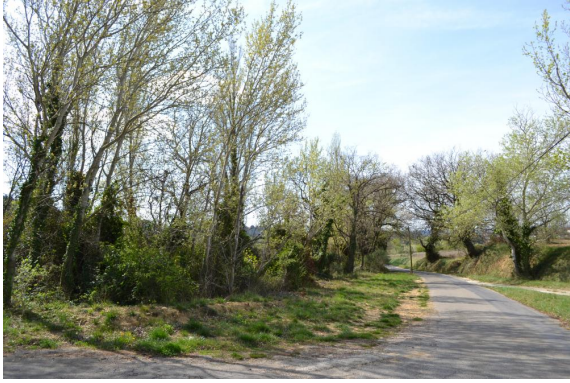
Ripisylve de Peupliers sur cours d'eau canalisé à proximité de la route.