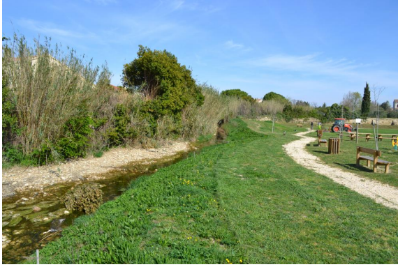
Aperçu des berges restaurées.