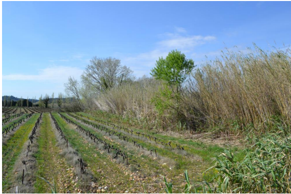
Cannier et ripisylve sur berges abruptes.