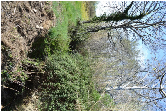
berges érodées et ripisylve très contrainte.