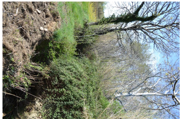
berges érodées et ripisylve très contrainte.