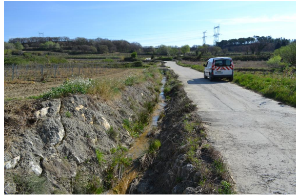
Fossés latéraux bétonnés contribuant à l'accélération des écoulements en période de hautes eaux.