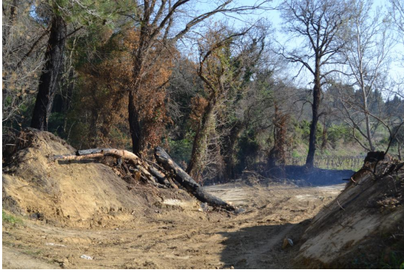
Coupe ponctuelle et brûlage.