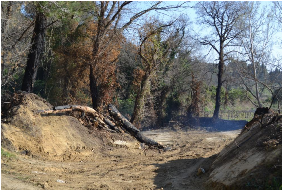
Coupe ponctuelle et brûlage.