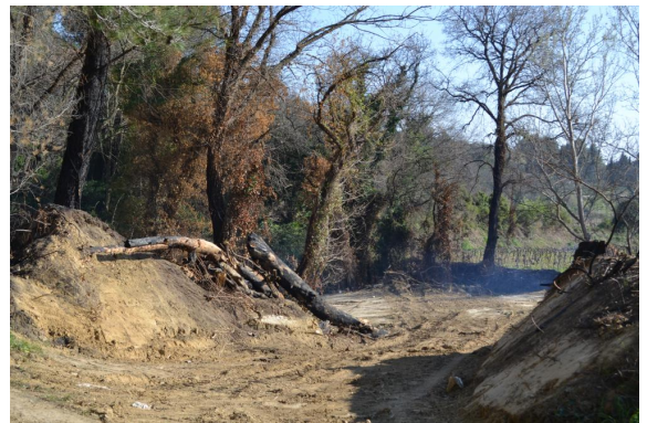
Coupe ponctuelle et brûlage.