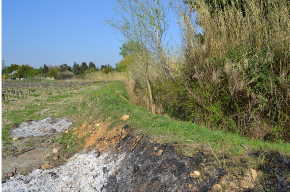
Merlon pour canalisation du cours d'eau, avec brûlage.