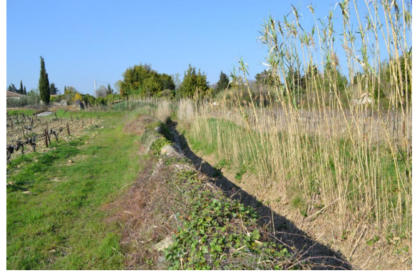
Cannier et roselière sur berges cours d'eau temporaire canalisé.